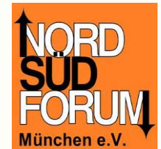
Nord Süd Forum München e.V.

Der Klimawandel ist ein globales Phänomen. Was können da individuelle und lokale Beiträge überhaupt bewirken? Ist Verzicht die Lösung? Mit welchen Folgen für die global vernetzte Wirtschaft?