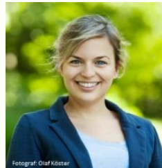
Katharina Schulze, stv. Fraktionsvorsitzende (Grüne)

Coffee-to-go-Pappbecher - allein für den deutschen Markt müssen jährlich ca. 43.000 Bäume gefällt werden. Was bedeutet das für die Wälder, den tropischen Regenwald und unser Ökosystem?