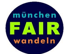
Arbeitsschwerpunkt des Nord Süd Forum München e.V.: München fairwandeln

Lohnt sich der Kauf von fair gehandelten Produkten überhaupt? Was bedeutet nachhaltiger Konsum und wie lässt er sich in unseren Alltag integrieren? Und auf welche Produkte gilt es dabei besonders zu achten?